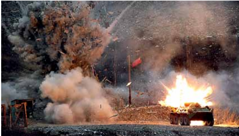
ВЗРЫВ «КУЗНЕЧИКА» ОКАЗАЛСЯ НЕОЖИДАННЫМ ДЛЯ ЕГО ВОДИТЕЛЯ

Позже, при просмотре рабочего материала, офицеры Черноморско-Азовского пограничного управления известного артиста Чадова вообще не узнали: «А кто это? Где вы его нашли? Это ж просто вылитый начальник, как будто вы его прямо с заставы сорвали?». Это была наша победа.