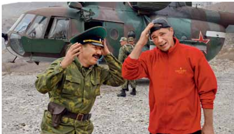
В КАРТИНЕ ЗАДЕЙСТВОВАНО МНОГО ВОЕННОЙ ТЕХНИКИ

собственное решение. Кино – это, конечно, труд коллективный, но здесь должно быть такое же единоначалие, как в армии, и командовать может только режиссер. Даже если в консультантах у него генералы и полковники (улыбается). Но при этом я никогда не начинал съемку, пока на площадке не будет хотя бы одного консультанта – для меня это был принципиальный вопрос.