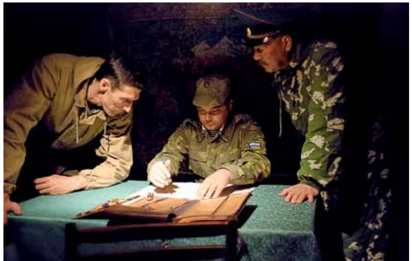
КАДР ИЗ ФИЛЬМА «ТИХАЯ ЗАСТАВА», В ГЛАВНОЙ РОЛИ АНДРЕЙ ЧАДОВ